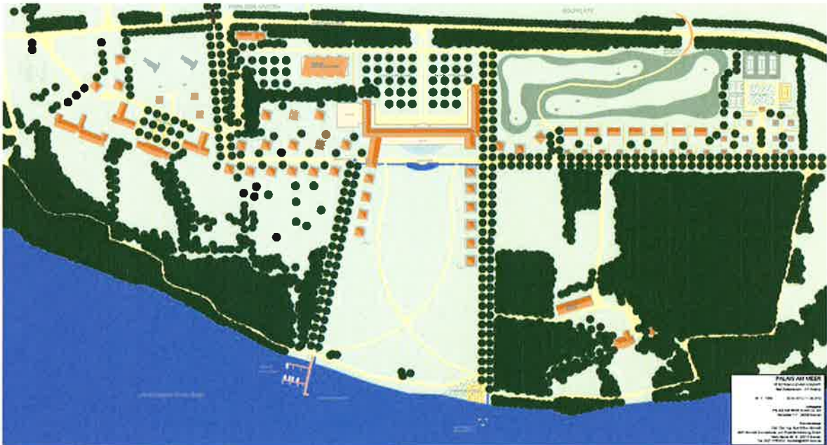
PALAIS AM MEER

Das Konzept zeigt die Qualität der Lage am Wasser auf und stellt die Verbindung her zum Park der Gärten, dem Golfplatz, der Ortslage Bad Zwischenahn über den öffentlichen Rad- und Fußweg und der weißen Flotte.