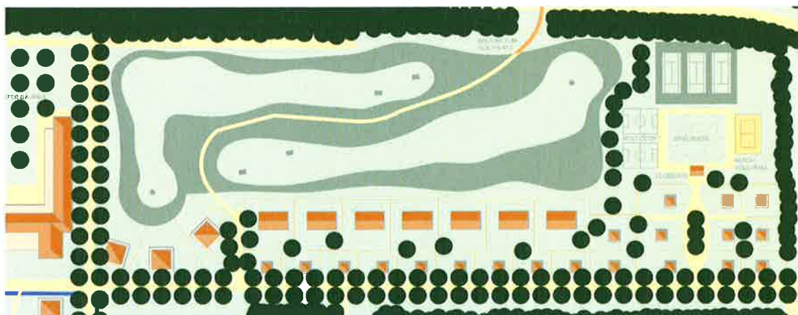
Golfplatzweiterung zum Hotel, Ferienhäuser und Sportangebote

Südwestlich erfolgt die fußläufige Anbindung zum „Park der Gärten“, geführt über zwei attraktive Sichtachsen unter alleinartiger Begrünung. Im Plangebiet weiter nordöstlich entstehen Ferienwohnungen. Im nordwestlich. Planungsraum erfolgt die Anbindung vom Golfplatz mit einer Fußgängerbrücke, die auch mit Golfcarts befahrbar ist.