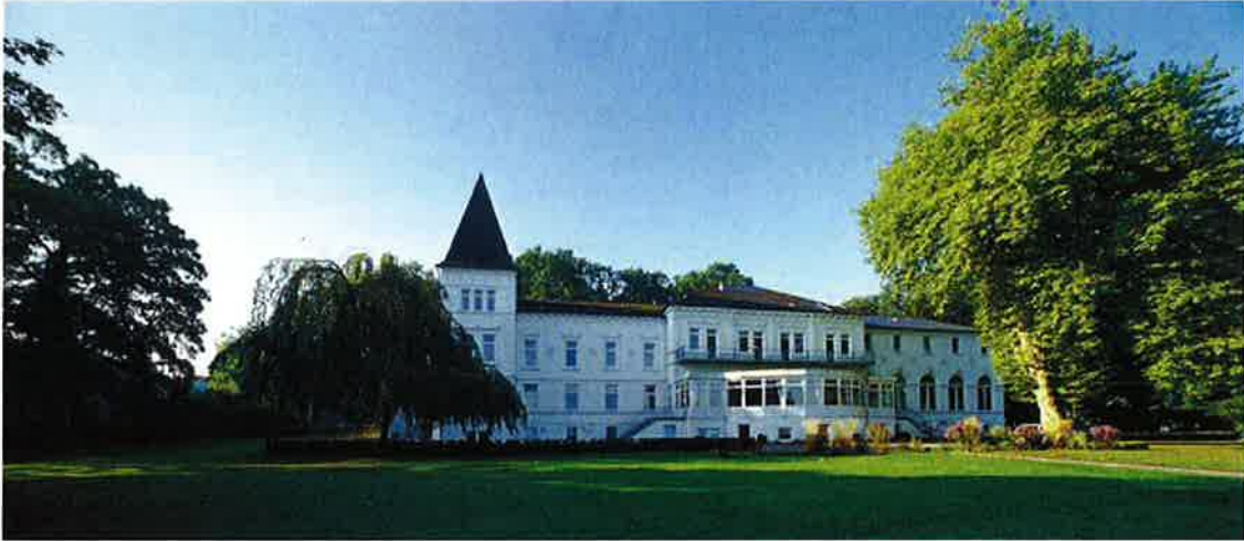
Bad Kultur in Bad Zwischenahn

Das Landschaftsfenster vor dem Hotel, gerahmt von den beiden Gebäudeachsen, bietet mit seiner lichten Weite eine spannungsgeladene Sichtbeziehung und Öffnung zum Wasser hin. Dieses wird vom Besucher des Hotels und von den Nutzern der öffentlichen Wege am Wasser erlebt.