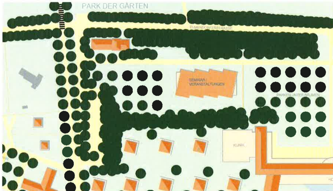
Klinik am Hotel, Seminar / Veranstaltung und die Achse zum Park der Gärten

Im Anschluss des Hotels befindet sich das Seminar und Veranstaltungsgebäude für bis zu 500 Personen sowie die Klinik / Gesundheitseinrichtung mit direkter Anbindung zum Hotel.