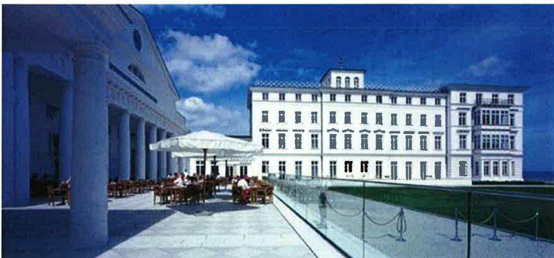
Die weißen Fassaden der Bad-Kultur in Deutschland, hier Heiligendamm

Im Erdgeschoss des Hotels befindet sich neben der Lobby die Gastronomie (großzügige Außen-Terrasse), der Wellness-, Fitness-, SPA- und Konferenz-Bereich, alle administrativen Einrichtungen, die Wohnungsvermittlung sowie sonstige Serviceeinrichtungen und