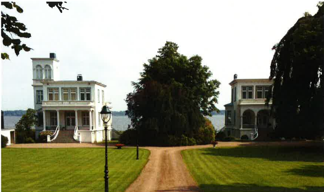
Zwillingstürme Bad Zwischenahn

Die vorhandene ortsbildprägende Bebauung in Bad Zwischenahn, mit den Zwillingstürmen und dem alten Kurhaus wird fortgeführt.