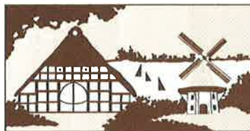
Museum Ammerländer Bauernhaus Bad Zwischenahn